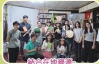
結合在地資源 響應見書聞捐書活動