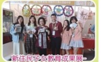
新住民子女教育成果展-北科附工成發