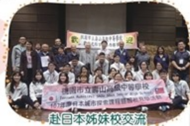
赴日本姊妹校交流