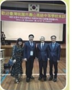
歡迎會兩校校長合影

回國後，學生們願意與校內同學們分享，學長姐也願意經驗傳承給學弟妹，讓本校的國際參訪交流能越辦越上軌道。