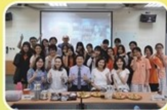
語言文化體驗-越南咖啡研習

為符應教育部教署「新住民子女教育發展五年中程計畫」，本校近年來不遺餘力地推展多元文化教育，以期營造不同族群共存共榮的友善環境；開設越南語言文化課程，強化新住民子女對母國文化的認同與溝通能力；在「國際教育」的概念下，配合十二年國教課綱素養導向之課程理念，發展跨科、跨領域之東南亞特色課程；並結合策略聯盟大學及在地社群資源，辦理東南亞語文活動，協助新住民子女尋根探源並回鄉鄉里；另申辦多項國教署主辦之新住民子女相關計畫，積極配合政府南向教育政策。秉持著「在地關懷、國際視野」的教育目標，由統整「校內」、結合「在地」到接軌「國際」。