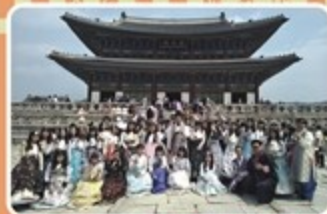
穿韓服遊景福宮合影