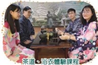
茶道、浴衣體驗課程