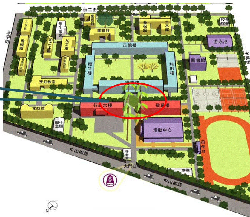
國立台南大學附中 研習場地位置圖