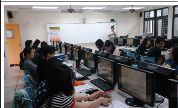
網路教學平台研習-研習教師認真聽講(2)