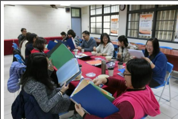
參與教學檔案研習教師進行討論及經驗分享(1)