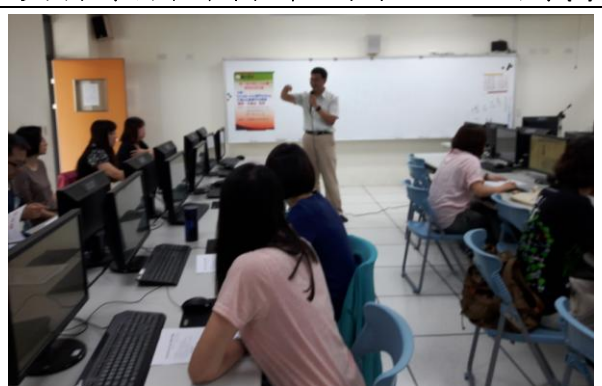
網路教學平台研習-研習教師認真聽講(1)