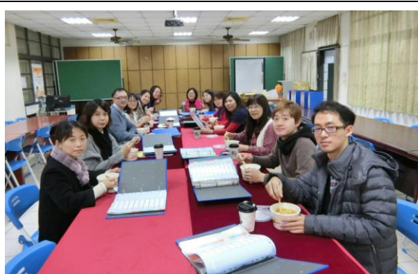
參與教學檔案研習教師進行討論及經驗分享(2)