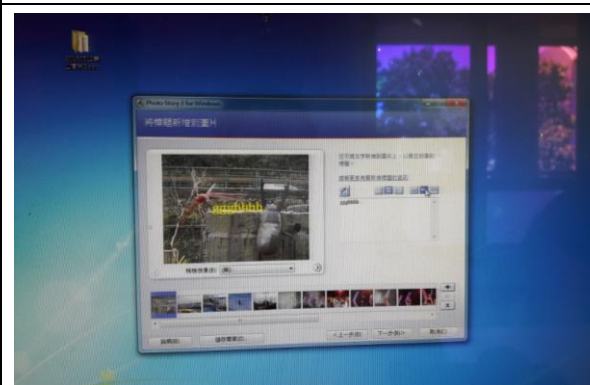
網路教學平台研習-實際操作