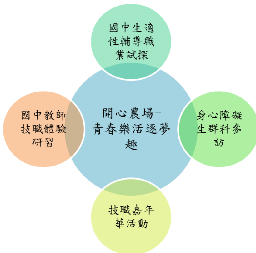
圖 1 子計畫 104-2 開心農場-青春樂活逐夢趣之五大課程主軸

延續歷年桃園二區教育資源均質化理念，橫向整合各子計畫內容，帶動本區高中職校際間資源共享與交流；舉辦技職嘉年華活動，由本校參與均質化計畫類科提供體驗及展示活動，結合本校社團表演，展現學校特色，增進社區民眾與國中生對技職教育的認知；邀請鄰近參與計畫學校展示及表演，提供平台讓各校展現辦學成效與推展特色，以達成桃一區計畫內高中職共同發展與提升的目標。