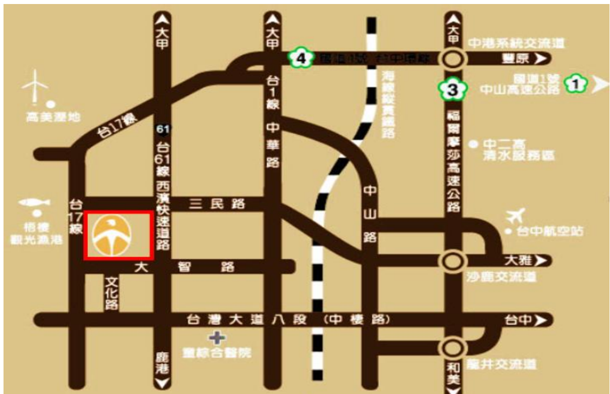
圖 1 臺中港酒店地圖

國道 3 號:沙鹿交流道下→行明德路→行三民路一段→左轉中華路→右轉民族路二段→左轉港埠路三段→續行港埠路二段→右轉大智路二段即抵。