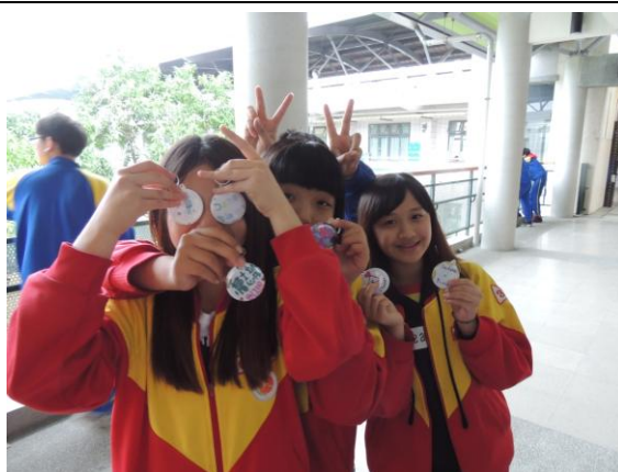
迴龍國中學生展示完成作品