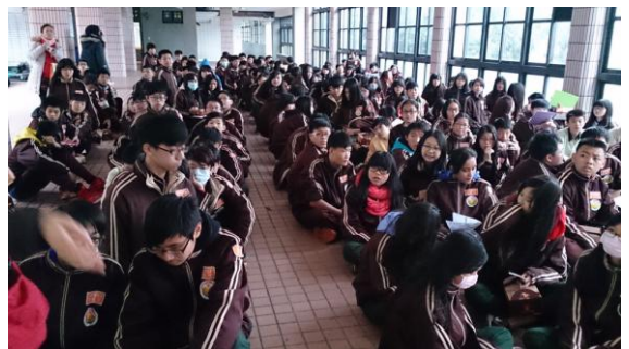
幸福國中- 課程結束集合準備上車