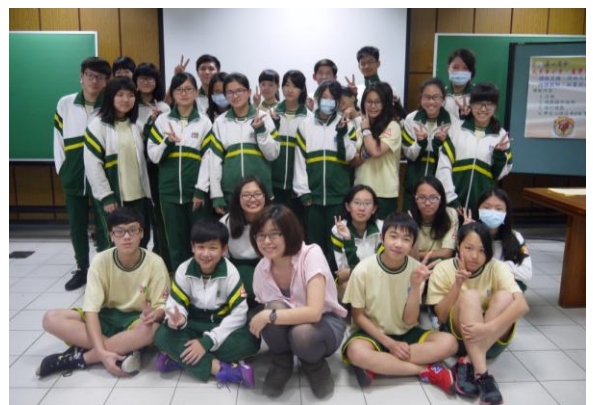
大有國中-理財大探索(現金流)合影留念