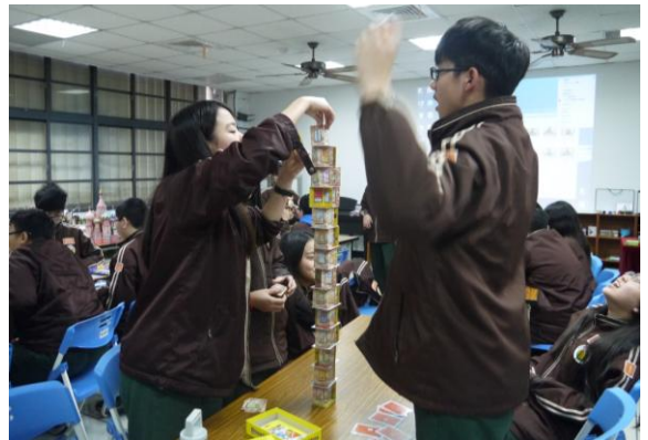
幸福國中- 遊戲式學習(桌遊)(1)