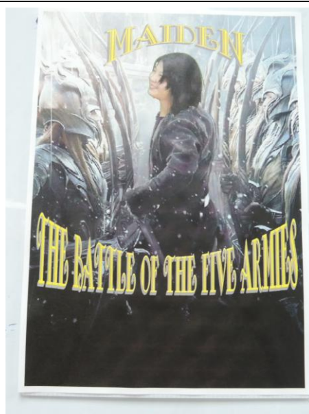
英語與攝影的奇妙世界-學生作品