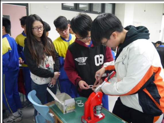
迴龍國中- 獨一無二創意徽章 (3)