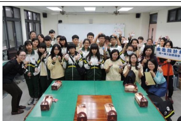
大有國中- 獨一無二創意徽章合影