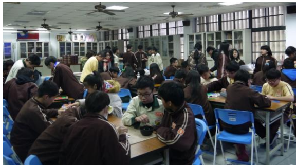
幸福國中- 遊戲式學習(桌遊)(2)