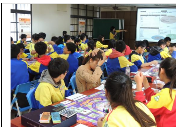
迴龍國中- 理財大探索(現金流) (1)