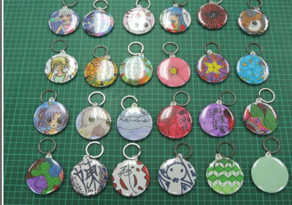
無一無二創意徽章作品