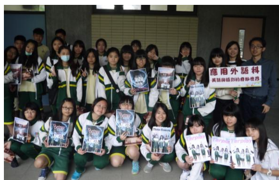
大有國中-英語與攝影的奇妙世界合影