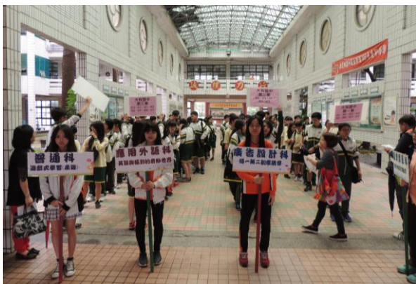
大有國中-集合準備進行體驗課程