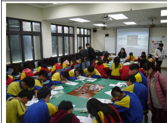
迴龍國中- 獨一無二創意徽章 (2)