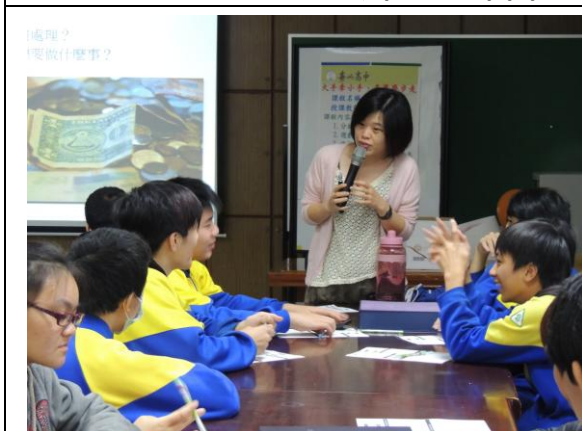
迴龍國中- 理財大探索(現金流) (3)