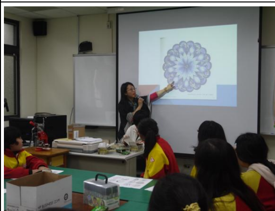
迴龍國中- 獨一無二創意徽章 (1)