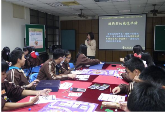
幸福國中-理財大探索(現金流)