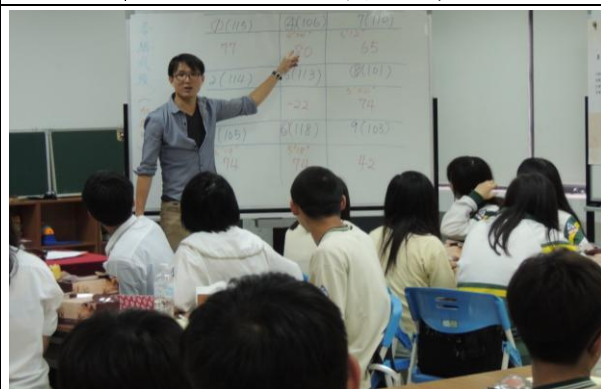
大有國中- 遊戲式學習(桌遊)