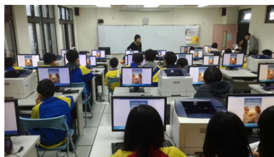
迴龍國中- 英語與攝影的奇妙世界 (2)