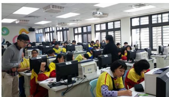
迴龍國中- 英語與攝影的奇妙世界 (1)