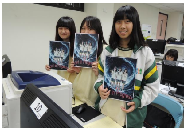
大有國中-英語與攝影的奇妙世界作品呈現