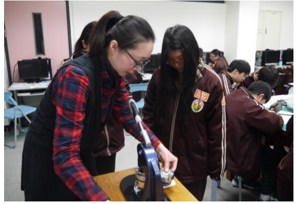
幸福國中- 獨一無二創意微