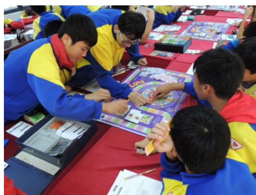
迴龍國中- 理財大探索(現金流) (2)