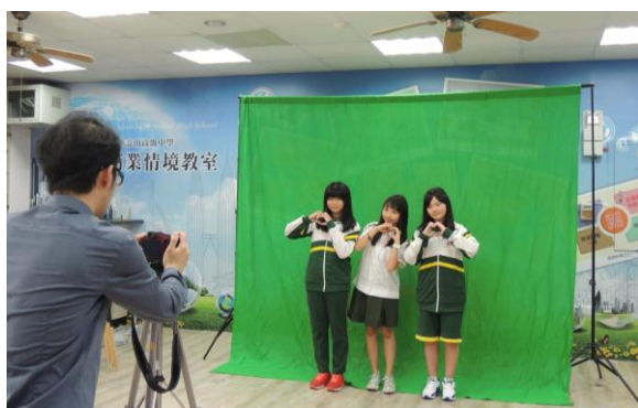
大有國中- 英語與攝影的奇妙世界