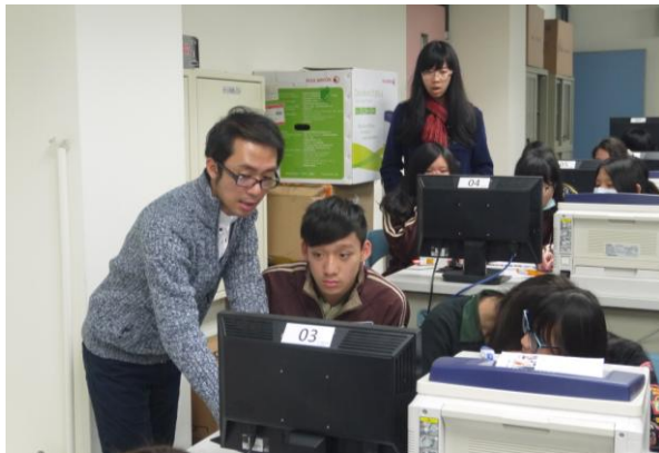
幸福國中- 英語與攝影的奇妙世界