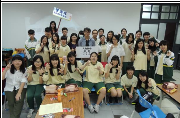
大有國中- 遊戲式學習(桌遊)合影