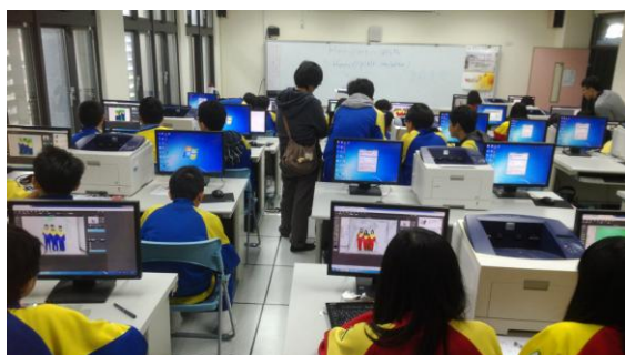
迴龍國中- 英語與攝影的奇妙世界 (3)