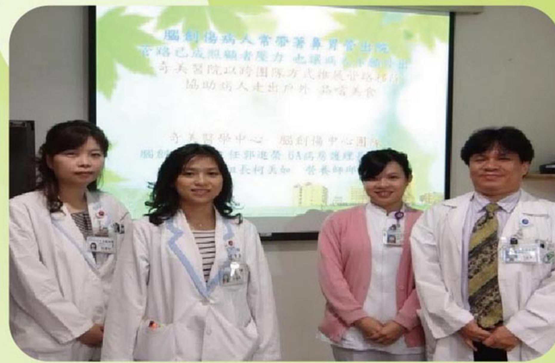
奇美醫院吞嚥治療團隊是本校師資陣容之一