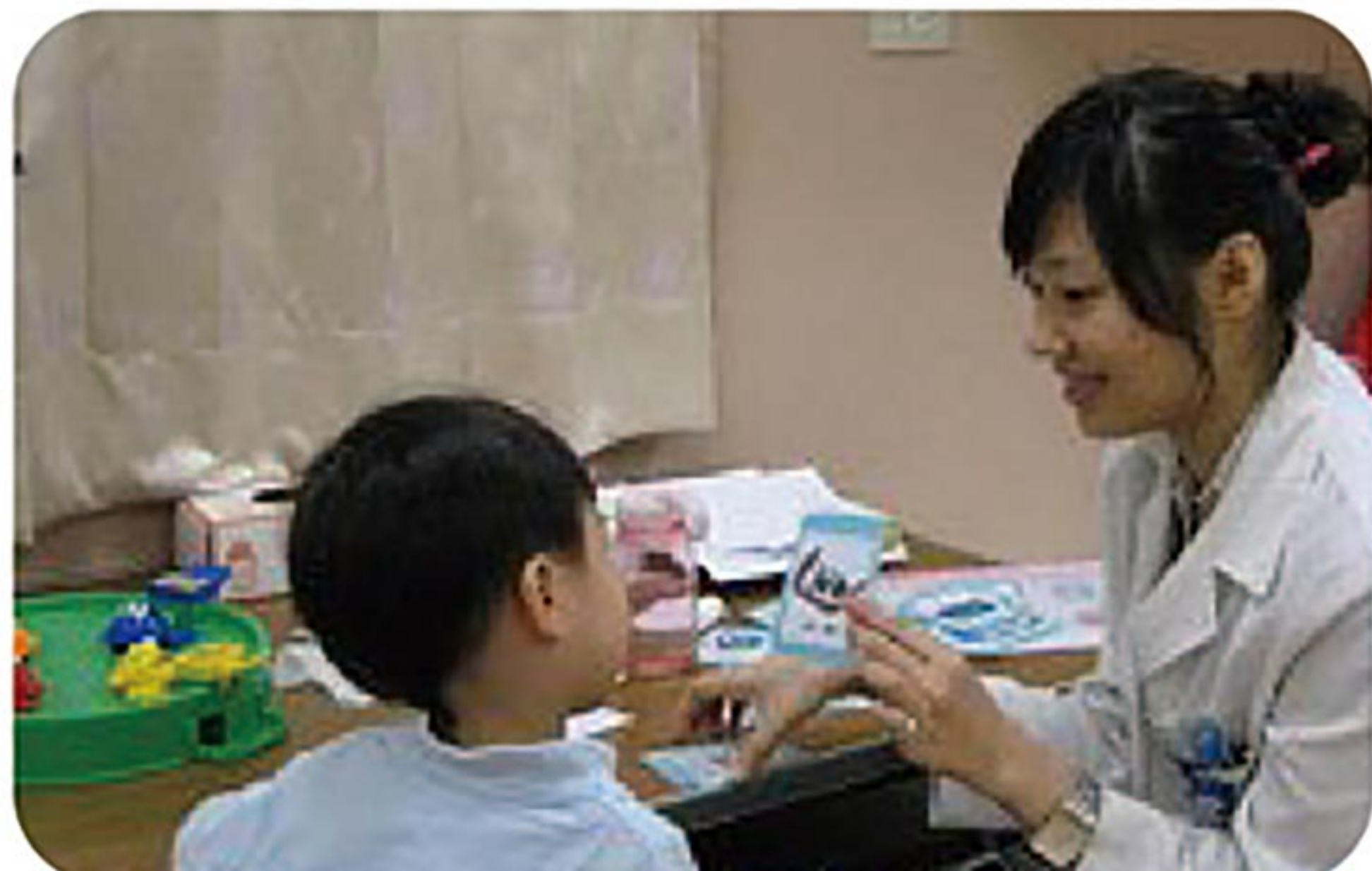
臺大醫院兒童語言治療的實習課程是中華醫大簽訂合作醫院之一