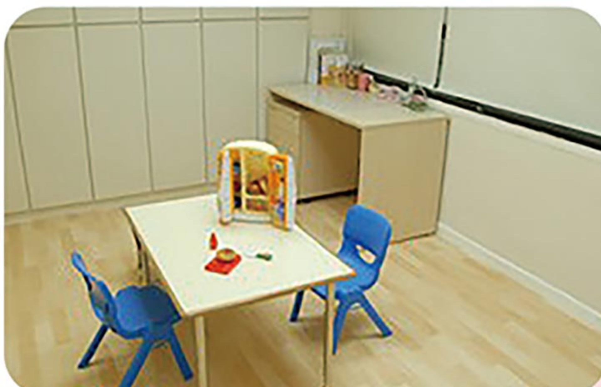
有愛無礙的中華醫大語言治療中心

連絡電話：06-2674567 分機445 專線：0952071769 (Line ID)