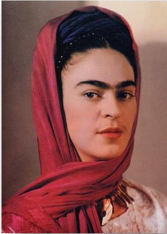
芙烈達 · 卡蘿 (Frida kahlo)