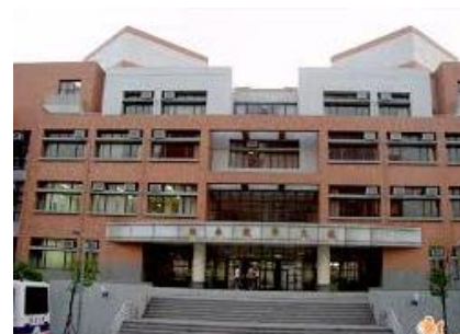
觀光語文大樓外觀