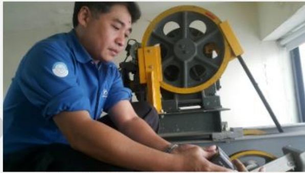
24hr待命不論風雨 資深電梯工程師守護回家最後一哩