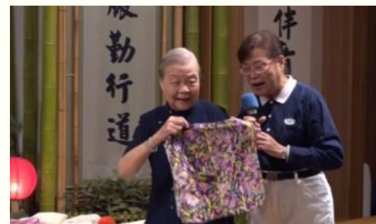
九旬孃成活菩薩 痾儂拾荒救地球