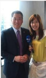
用新聞扭轉弱勢生命 守護正面價值