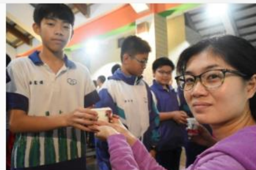
熱血教師 助學子築夢人生