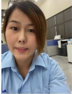
幫助別人 讓我得到最美好的禮物