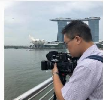
攝影記者盼用鏡頭傳遞生命價值 扛機上山下海不喊苦