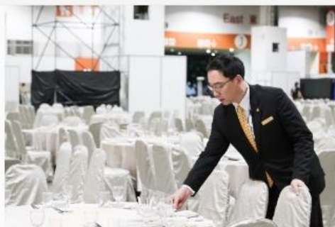
客人的笑容是我工作的驕傲