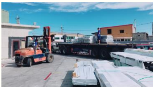
有血有淚的最難忘回憶+最大的貢獻