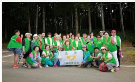
無私奉獻 守護你上下車安全的每一步