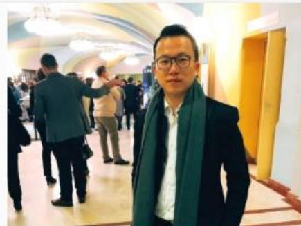
串聯產學全網營銷 玉山網協為中小企業外貿 持續奮鬥