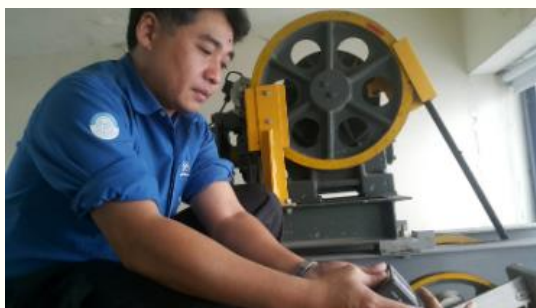
24hr待命不論風雨 資深電梯工程師守護回家 最後一哩

https://event.1111.com.tw/event19/workvote/contributor.asp