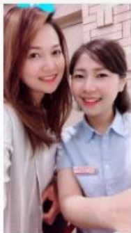
樂於助人 客服生涯十五年 獲得滿滿喜悅