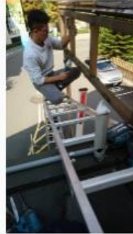
生死一瞬間 鋁窗工踩空遮雨棚 女屋主冷回「還要花錢修」