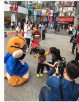
身穿30公斤吉祥物 操偶師：「能給觀眾快樂，這重量不算甚麼」