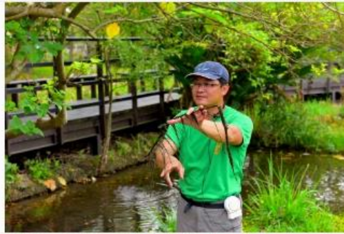
腳踩泥土日晒雨淋 保護候鳥「總得有人做」