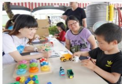
播下特教的希望種子！25年用愛深耕偏鄉 帶來陽光歡笑 造福無數家庭