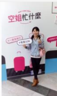
陪伴孩童快樂健康長大的萬能老師~