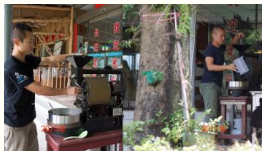
二代接班 仙湖農場吳侃薈 揮汗柴焙桂圓世界 飄香