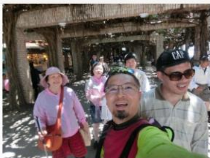
旅遊業的「圓夢大使」 讓身障人士也能上山 下海玩透透