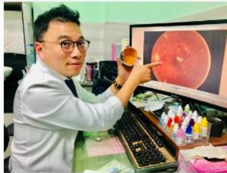
回歸家鄉基層診所的醫學中心眼科主任