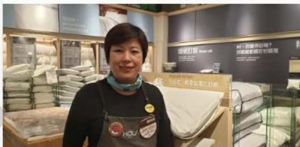
一份待客如親的堅持 讓服務更有溫度