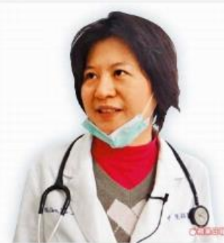
完成史懷哲之心願 - 嫁去綠島的女醫