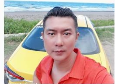
忙碌但動人的夜晚 計程車司機見證母女親情時刻