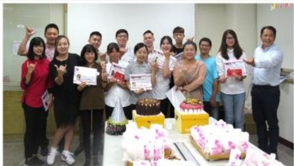
餐飲外場貼心服務感動顧客 為了她，客人一週用餐三次