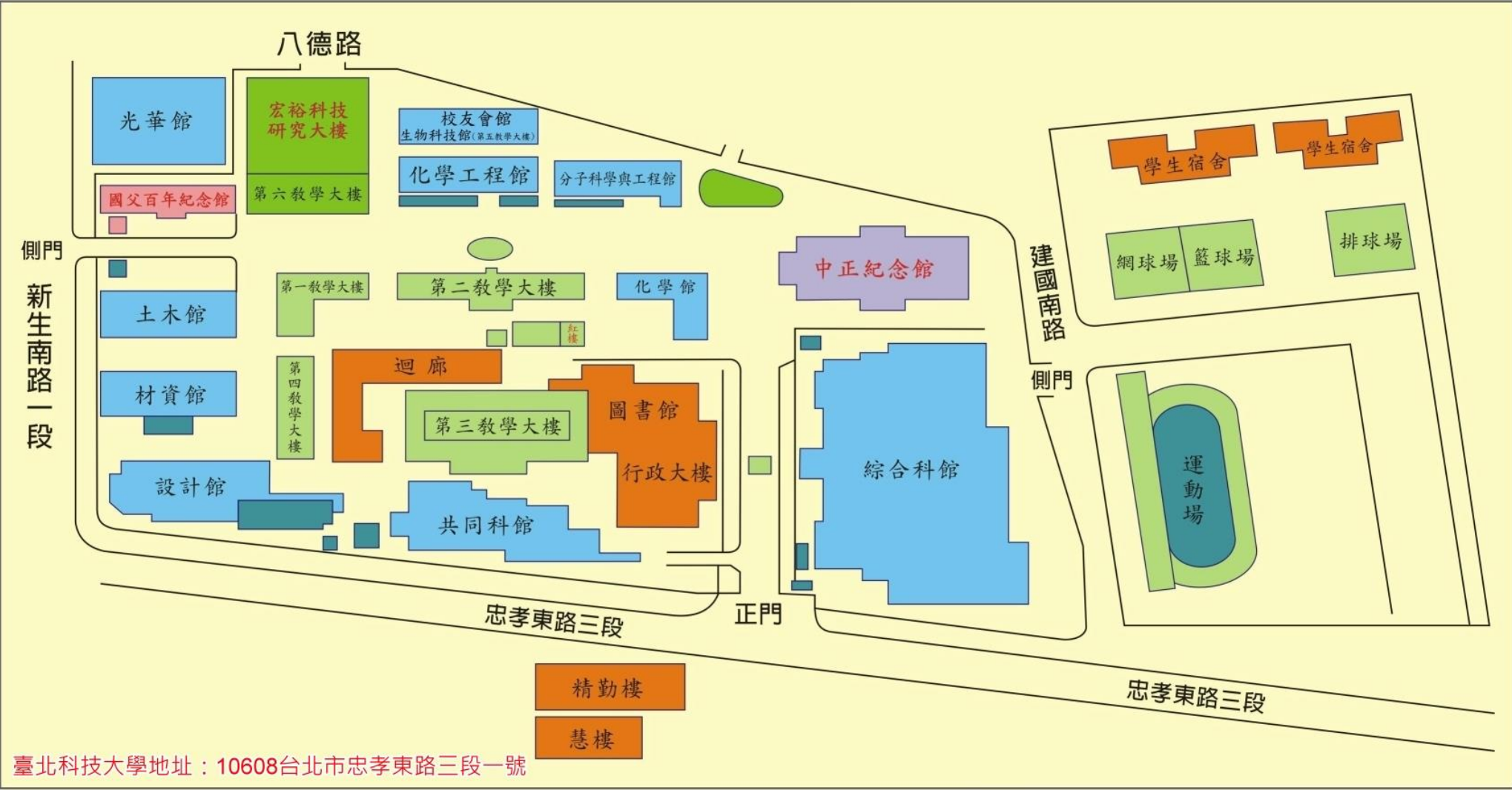
附件十二：國立臺北科技大學校區平面圖