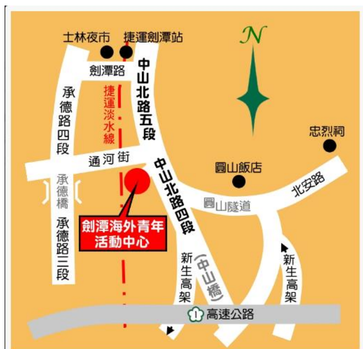
劍潭海外青年活動中心園區平面圖