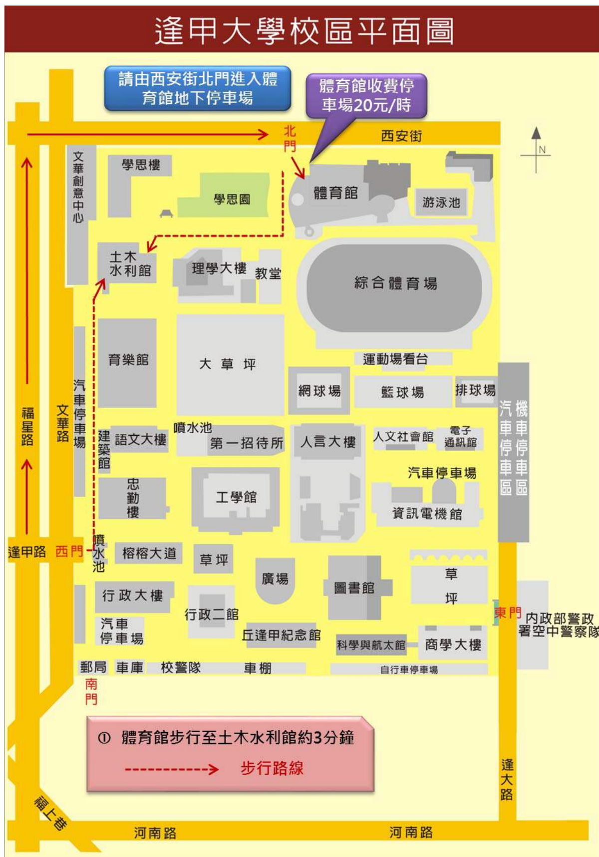
逢甲大學體育館停車場位置圖