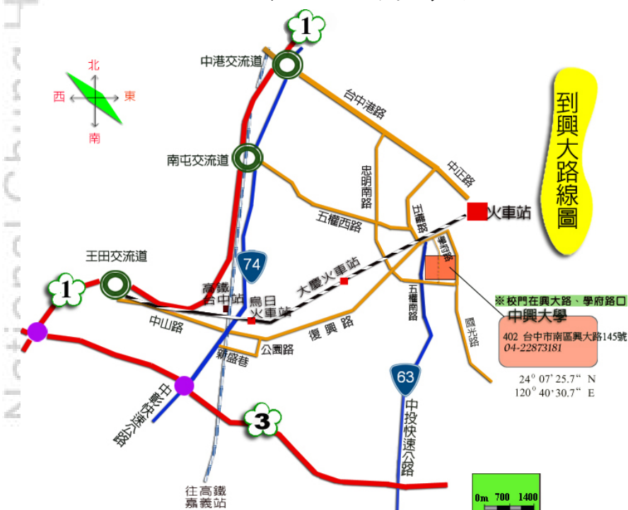
國立中興大學交通路線參考圖

(二)由國道3號福爾摩沙高速公路：209K 中投(台中)交流道下→接 63 線中投快速公路，往臺中市區方向→五權南路→忠明南路(右轉)→興大路(左轉)→中興大學。