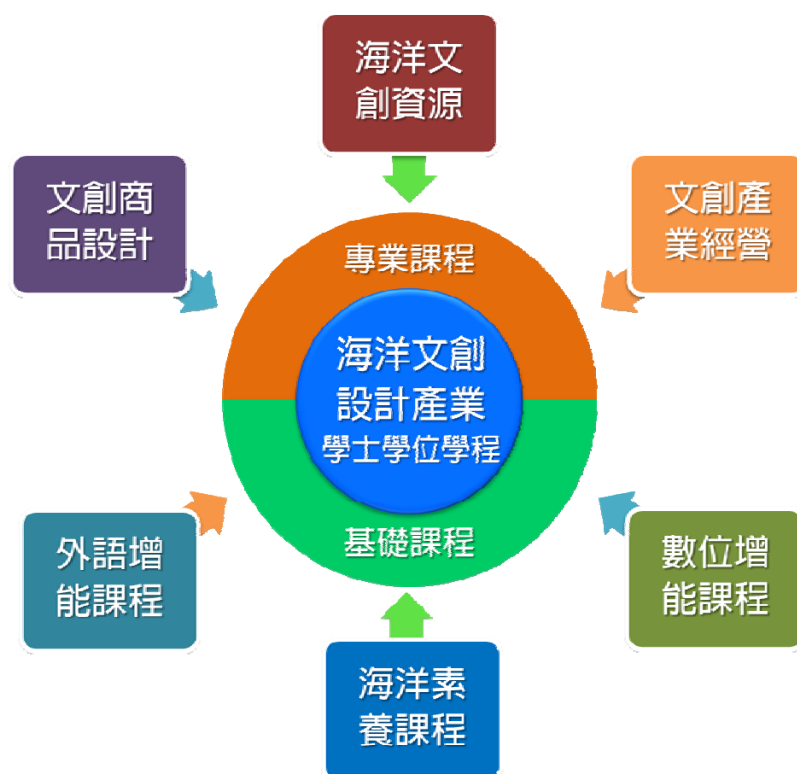
圖1 海洋文創設計產業學士學位學程課程架構圖