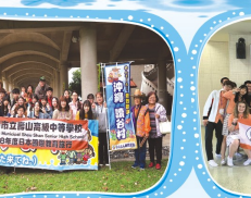
日本琉球景點參訪見學