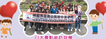
日本景點參訪見學