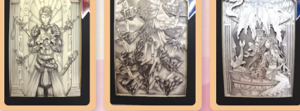
第一名114趙于萱 第二名114呂欣如 第二名114葉洛澐