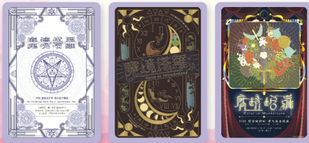
第三名213許夏原 第三名214曾芷萱 第三名214楊清皓