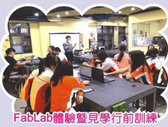
FabLab體驗見學行前訓練

此外，今年安排在姊妹校學生家庭的homestay，使同學更能深入日本人日常生活外，特意讓學生攜帶行動裝置進行全日文的台灣文化與學校介紹，不但令寄宿家庭感到驚艷，更使得雙方的交流更豐富，除了以往融入日本在地的澡堂、飲食文化等，更加深化教育的意義。(教務處實研組撰文)