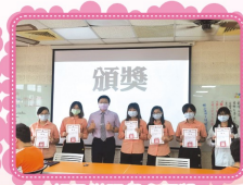
視訊辦理朝會頒獎