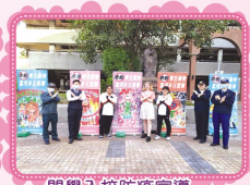
開學入校防疫宣導