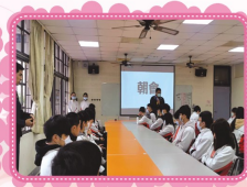
視訊辦理朝會活動