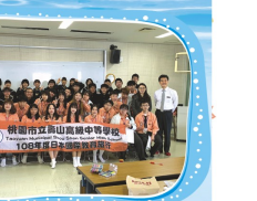
北山高校參訪見學