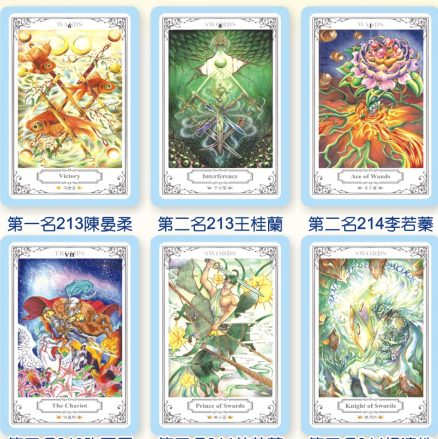
第一名213陳晏柔 第二名213王桂蘭 第二名214李若葉