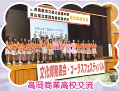
文化研習會・コース交流