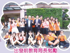
出發前教育局長勉勵