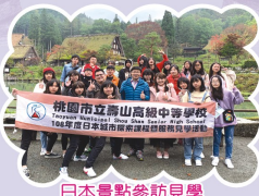
高岡商業高校交流