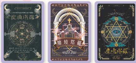
第一名213陳晏柔 第二名213王桂蘭 第二名214李若葉