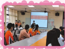
視訊辦理開學典禮