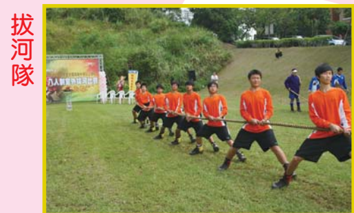
教育部98年度全國高級中等以上學校八人制室外拔河比賽第六名