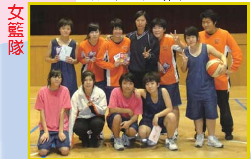
98年桃園縣議長盃籃球錦標賽高中女子組季軍全國高中籃球聯賽桃園縣女子乙組亞軍