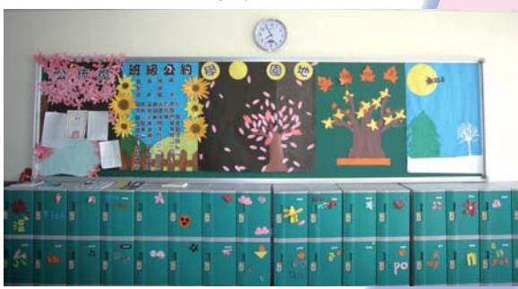
教室布置比賽特優106