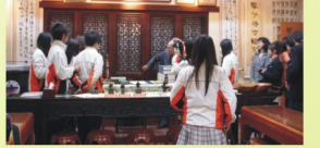
語文學院的院長帶領同學參觀「中華茶道文化研究中心」，院長說桌後的太師椅有八百年的歷史嘍！