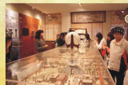
中文系的系主任帶領同學參觀「經學研究中心」，玻璃櫃中展示著「清明上河圖」的模型呢！