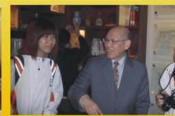
院長向同學介紹「紅學研究中心」，裡頭的裝潢和擺設都與《紅樓夢》息息相關呢！