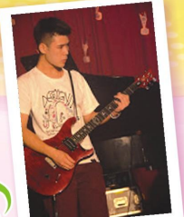
認真的男生最帥氣