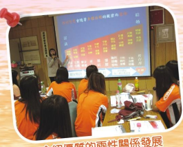
介紹優質的兩性關係發展