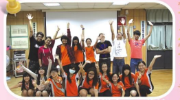
籌備團隊合影(機構志工、學校教師、畢業生)