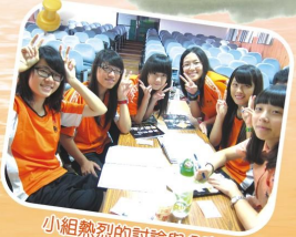
小組熱烈的討論與分享