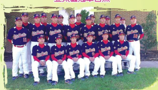
代表亞太區美國賽前合照