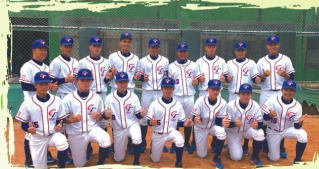
國內賽前合照 (平鎮、泉僑、壽山)

中華青棒隊今年LLB比賽，從亞太區一路戰到美國國際組冠軍賽，過程精采動人，最後一戰雖敗猶榮，明年還有機會捲土重來。