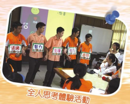
全人思考體驗活動