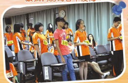
真實又深刻的體驗活動