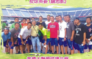
美國大聯盟球場合照