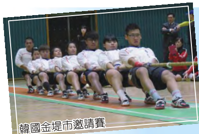
韓國金堤市邀請賽

姊妹校交流的意義在於留下珍貴的記憶與拓展國際視野，相信這樣的經驗對不論是台灣還是日本，對大多數的高中生而言都是珍貴的，也讓壽山高中同學，在參訪與回訪交流的過程中，得到最棒的收穫。