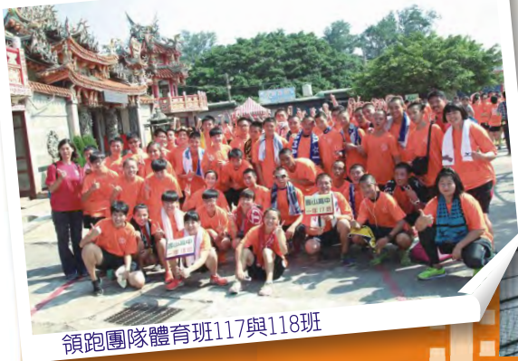
領跑團隊體育班117與118班