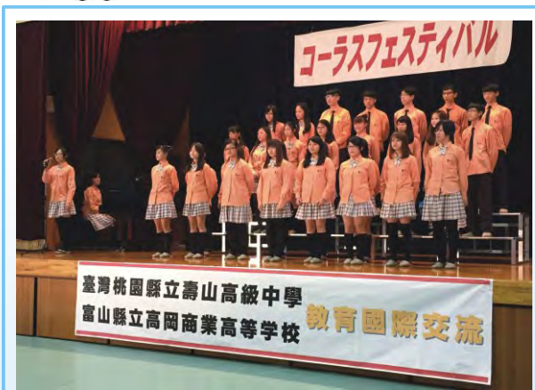
壽山高中學生合唱比賽表演