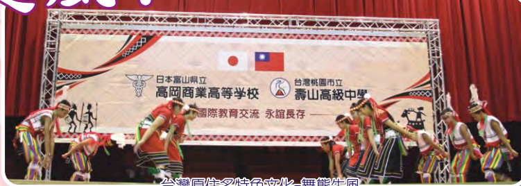
台灣原住民特色文化-舞態生風