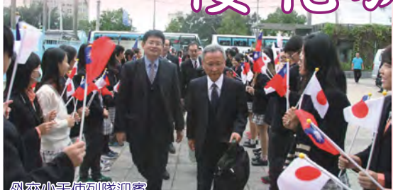
外交小天使列隊迎賓