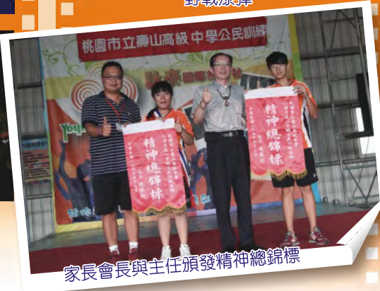
家長會長與主任頒發精神總錦標