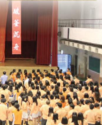
破釜沉舟、百尺竿頭