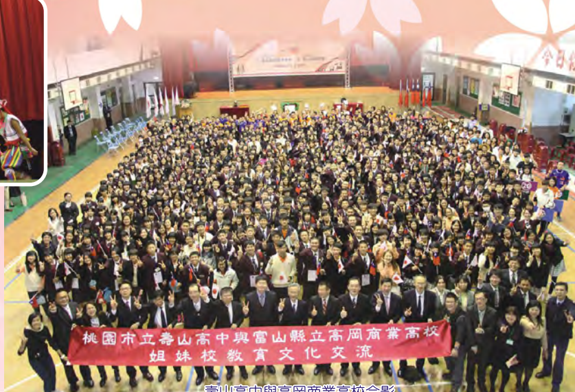
桃園市立壽山高中與富山縣立高岡商業高校 姊妹校教育文化交流