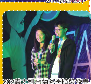
202義大利米蘭冬季時裝發表