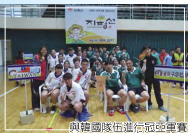
與韓國隊伍進行冠亞軍賽

邀請賽，當然不負所望，順利奪冠。受邀參加韓國全國賽中的公開賽，韓國協會表示台灣是他們眾多邀請隊伍的首選，我國的拔河賽成績可說是有目共睹。這次的韓國行當中除了參賽，選手們更是韓國爭相模仿學習的對象，受到相當的禮遇，除此之外，當地舉辦了一年一度的祭典，可讓同行的每一個人更深刻體驗到韓國文化，以繩交友之外，同時拓展了大家的國際視野，相當具有意義。