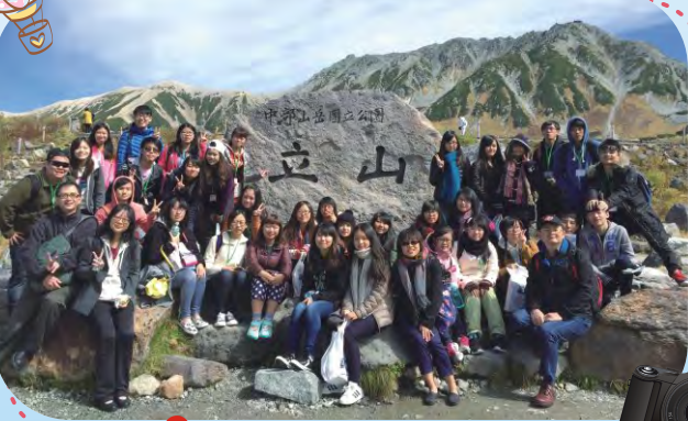
東方阿爾卑斯-立山上合照