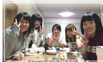
和home家3姐妹一起拍照