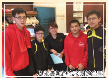
與永豐麵包店老闆娘合影

社會中總有許多這樣默默付出，提供一點點自己能力所及的資源的人；帥哥老闆從不問拔河隊成績表現如何，關心的都是大家有沒有吃飽，這樣的溫暖讓同學們感受點滴在心頭。拔河隊風光成績表現的背後，可是有這位推手為我們提供具有魔力的能量呢！下回如果你也遇見這位帥哥老闆，別忘了點頭微笑，有機會順便品嚐那會使拔河隊充滿力量的麵包！