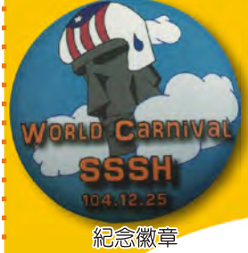
WORLD CARNIVAL SSSH 10.4.12.25 紀念徽章