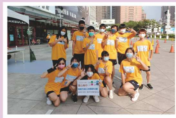
用愛洗車公益募款活動