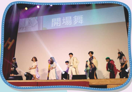
每年十二月的木瓜尬橘子