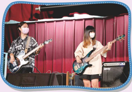
社團總成果發表會